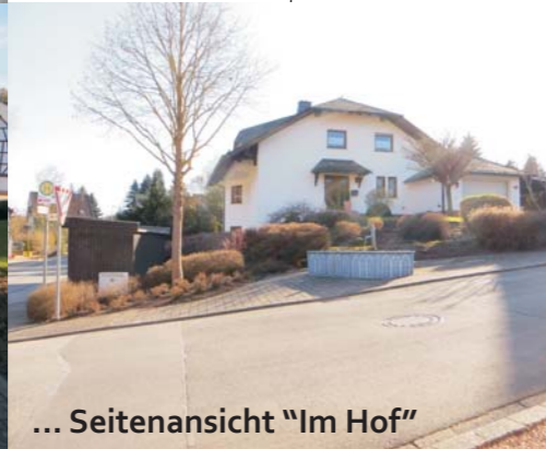
... Seitenansicht "Im Hof"