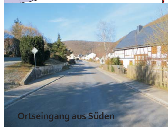
Ortseingang aus Süden