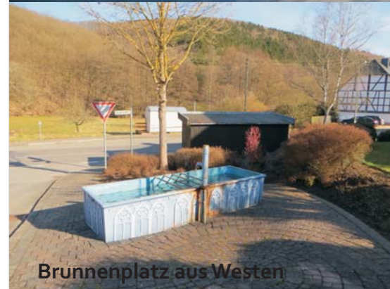
Brunnenplatz aus Westen