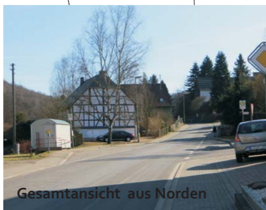
Gesamtansicht aus Norden