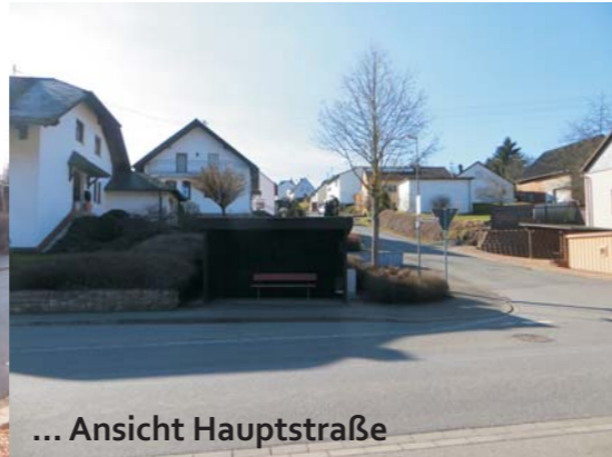
... Ansicht Hauptstraße