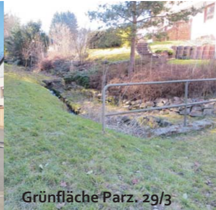
Grünfläche Parz. 29/3